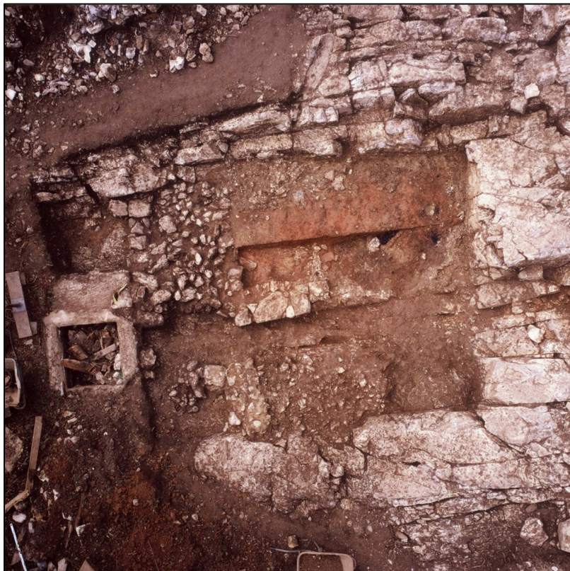
Sl. 2: prazgodovinska poglobitev v geološko osnovo, kasneje uporabljena kot hlev Delezove domačije (fotografija iz izkopavanj leta 2004, A-stativ 9m)

Najzanimivejša od naključnih najdb je znana najdba Kmeta Deleza iz Matavuna, ko je 1. 1908 pri rušenju starega prazgodovinskega zidu škocjanskega gradišča zadel pod apnenčevo ploščo na skeletni grob s številnimi pridatki. Gre za 1169 bronastih predmetov in jantarjevih jagod (med njimi 454 jantarjevih jagod in steklenih biserov, 486 bronastih gumbov, 4 votle zapestnice, 54 bronastih obročkov, 2 železna obroča, 3 zapestnice, 1 torkves, 22 obeskov, 20 spiralnih cevčic, 8 okrasnih ploščic, 2 certoški fibuli, glinasta in koščena vretenca itd.). Grobni pridatki datirajo vso najdbo v 5. stol. pred n. š. (Marchesetti, JfA 3, 1909, 194. Battaglia, Duemila Grotte [1926] slike na str. 97, 98, 99, in Atti Mus. Civ. di St. Nat. Trieste 15, 1942, 44). V letu 2004 je bilo pod vodstvom Petra Turka – Narodni Muzej opravljeno manjše zaščitno izkopavanje v Škocjanu na Krasu, istega leta je na mestu nekdanje Delezove domačije izkopaval tudi Koprski Muzej pod vodstvom Mateja Zupančiča. Odkrite so bile dobro ohranjene arhitekturne ostaline bivališč iz bronaste dobe. Razpoklinski sistem apnenčastega pokrova nad Škocjanskimi jamami je omogočal nekdanjim prebivalcem, da so z lomljenjem kamnitih blokov vzdolž razpok prišli do pravih pravokotnih poglobitev v matično geološko osnovo, ki so jih izkoristili kot bivališča oziroma polzemljanke. Na mestu nekdanje Delezove domačije sta bili dve takšni poglobitvi (3x3m, 4x5m) izkoriščeni in sicer za klet in hlev.