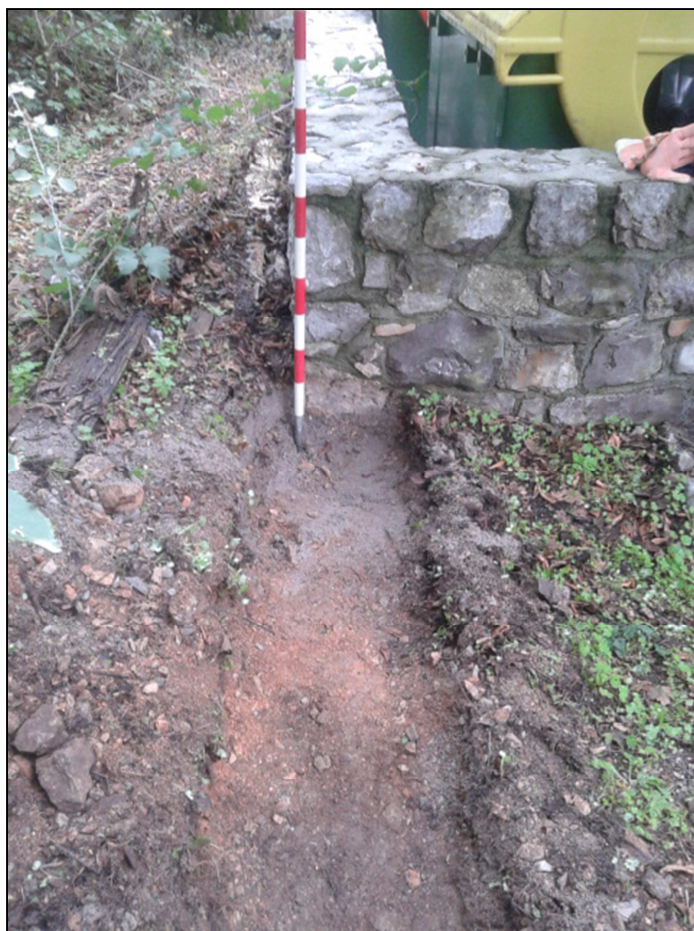
Sl. 2: Plitek izkop za temelj, pogled proti J