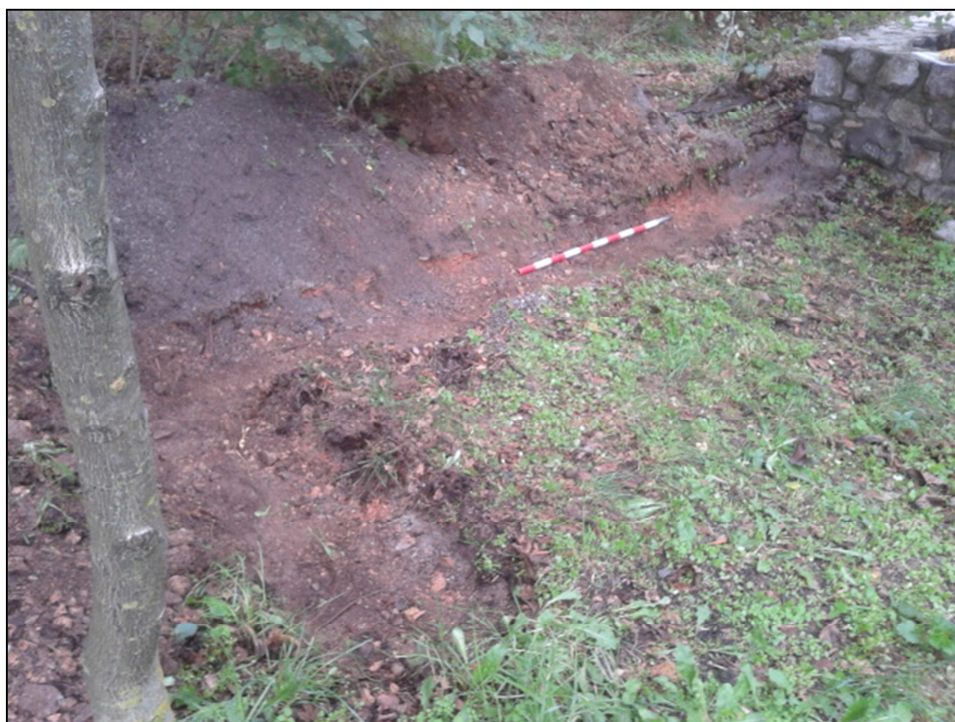
Sl. 3: Izkop za temelj, pogled proti JV.