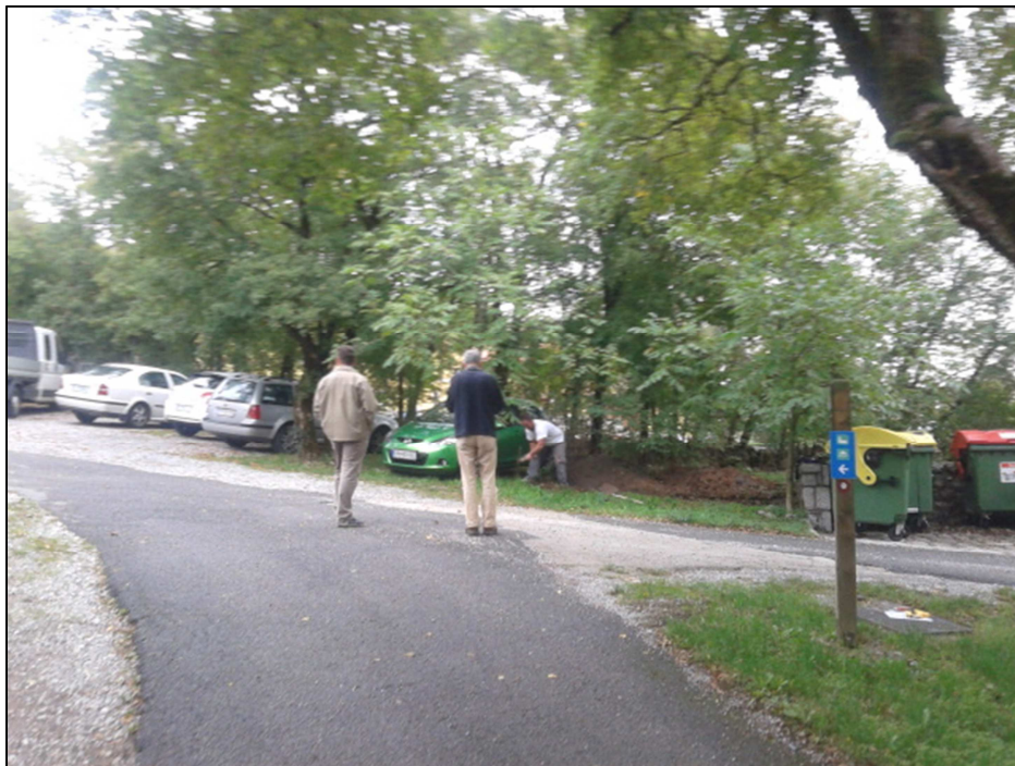
Sl. 1: Lokacija posega, pogled proti V

Cilj raziskave je bil dokumentirati, strokovno odstraniti in ovrednotiti morebitno arheološko kulturno dediščino na območju arheološkega najdišča Škocijan pri Divači. Investitor občina Divača - KS Matavun je izvajala širitev obstoječega ekološkega otoka na parc. št. 695 k.o. 2460 Naklo. V skadu z kulturnovarstvenimi pogoji 35106-324-2/2013-BBr/V smo ob izkopu izvajali arheološko raziskavo v obliki arheološkega dokumentiranja ob gradnji. Dela so potekala vzdolž ceste ob obstoječem komunalnem otoku. Prav zaradi recentnih posegov v neposredni bližini in na sami lokaciji je bila področje poškodovano, intaktnih plasti ob izkopu niso dosegli.