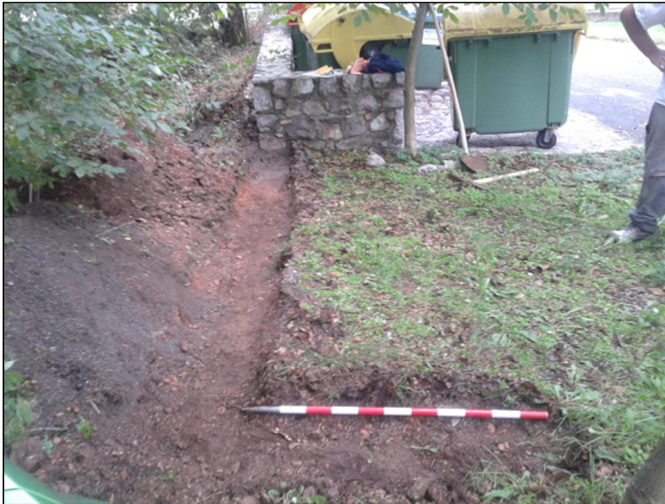
Sl. 4: Pogled na celoten izkop proti J